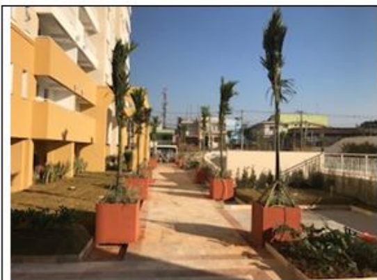
Figura 1– Vista Passeio Térreo Externo