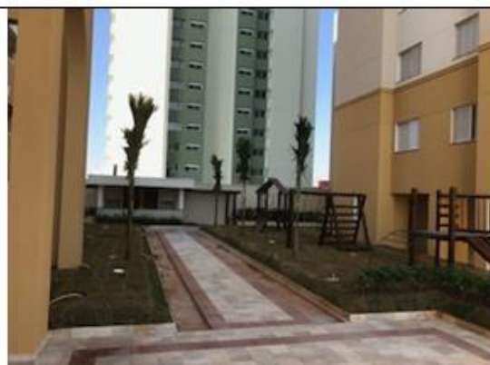
Figura 2– Vista Playground