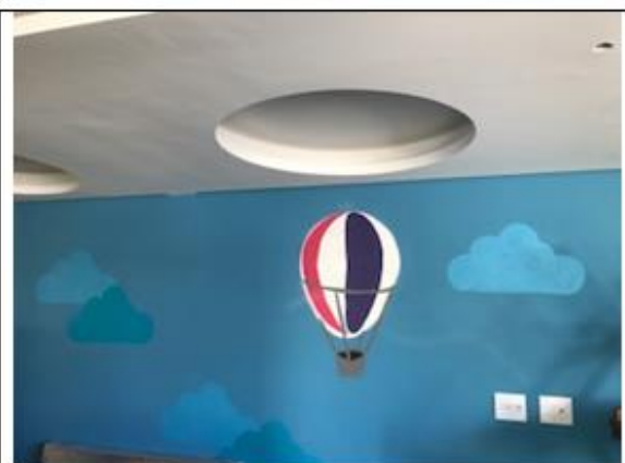
Figura 8- Vista Grafite Brinquedoteca