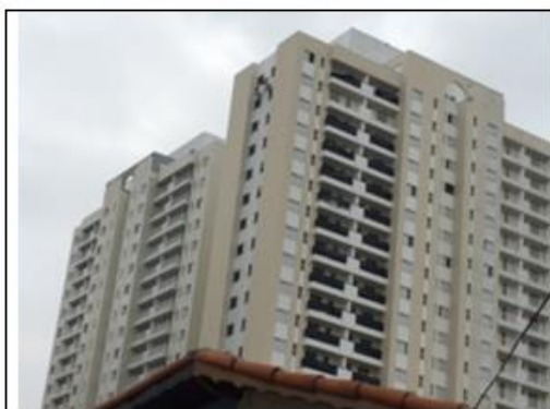
Figura 1– Vista Fachada Fundos Torre A e B