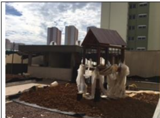
Figura 7– Vista Casa do Tarzan - Playground