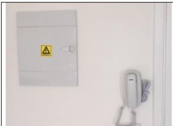
Figura 19- Vista Quadro de Luz/Interfone Aptos