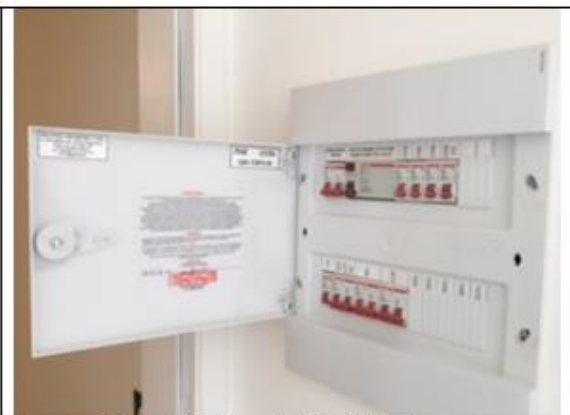
Figura 20- Vista Quadro de Luz Aptos