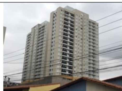
Figura 2– Vista Fachada Fundos – Torre A e B