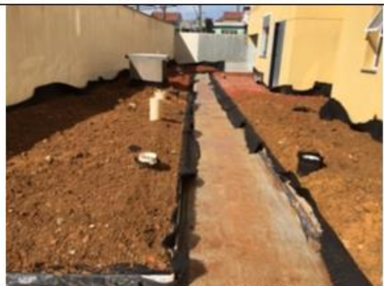
Figura 8– Vista Preparação Jardins